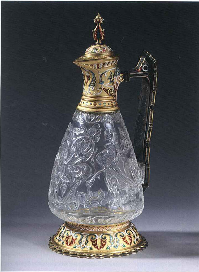
Bergkristallkrug. Höhe: 30,7 cm. Museum für Islamische Kunst – Keir Collection/ Sammlung de Unger.

jekte gewesen sein, mit denen sich die höfische Gesellschaft umgab. Davon zeugen nicht zuletzt die heute noch erhaltenen fatimidischen Kunstwerke selbst, die sich durch großes handwerkliches Können und kostbare Materialien auszeichnen. Ein zeitgenössischer Bericht spricht von 36 000 Objekten aus geschliffenem Glas und Bergkristall. Beispiele hierfür sind äußerst fein gearbeiteter Schmuck, der die in Byzanz verbreitete Technik des Emaildekors aufgreift, golddurchwirkte Textilien sowie geschliffene Bergkristalle mit floralem oder figürlichem Dekor.