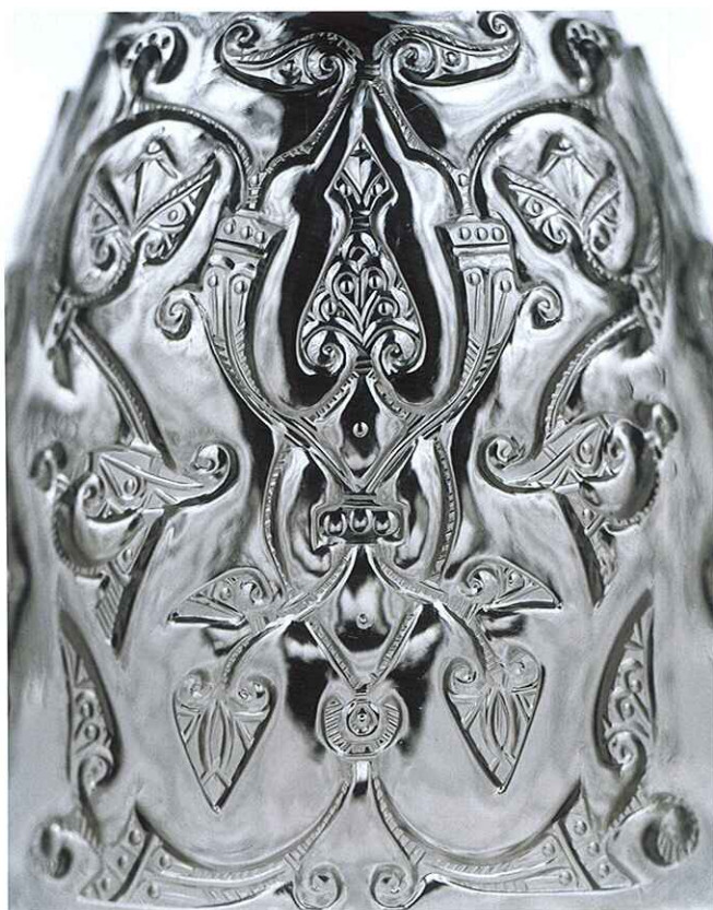
Bergkristallkrug (Detail). Museum für Islamische Kunst – Keir Collection/ Sammlung de Unger.

Der tausendjährige Bergkristallkrug aus der Sammlung Edmund de Unger